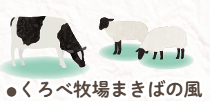
くろべ牧場まきばの風