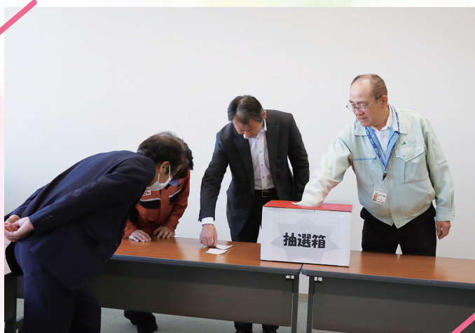
各景品の当選者を選出