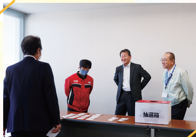
たくさんの方の応募に感謝

JAくろべサービス株式会社は3月9日、令和7年度「JA配達灯油サックスキャンペーン」の抽選会を行いました。