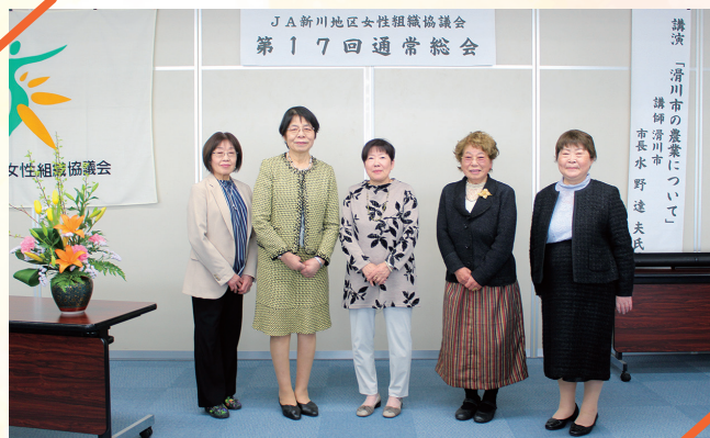
新年度も頑張ります

JA新川地区女性組織協議会第17回通常総会が3月28日、JAアルプス本店で行われました。