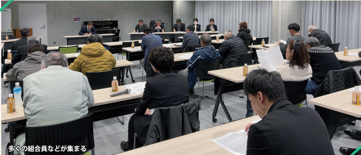
多くの組合員などが集まる