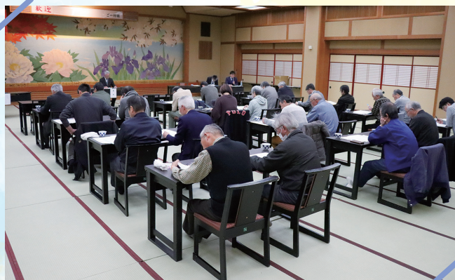
生産者など多くの関係者が出席

令和7年度黒部市農協前沢採種部会通常総会が3月6日、金太郎温泉（魚津市）で開かれ、部会員や関係者など35人が出席しました。