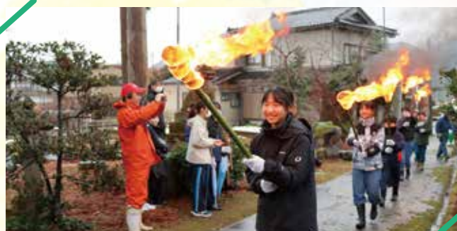
ご神火を灯した児童

江戸時代から続く左義長「おんづろこんづろ」が1月17日、下立神社で行われ、地元住民などが参加しました。