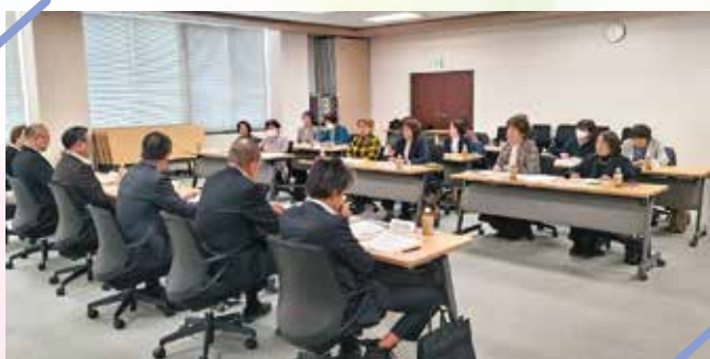
意見や要望を交わす

JAくろべ役職員と語る会が1月16日、当JA本店で開かれ、JAくろべ女性部の部長をはじめとした女性部役員、JAくろべ役職員など関係者20人が参加しました。