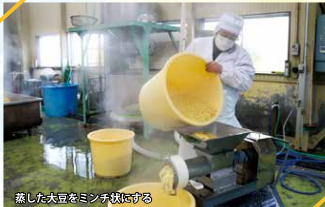
蒸した大豆をミンチ状にする