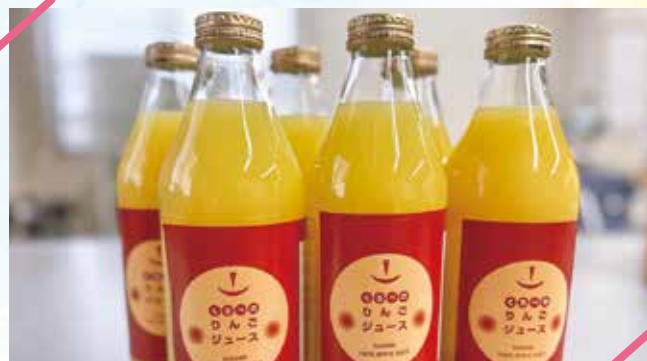
くろべのりんごジュース