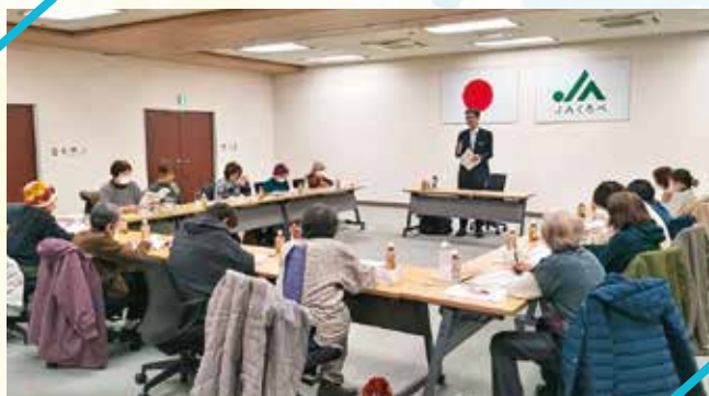
防災についての話を聞く参加者

第4回JAくろべ女性大学が1月14日、当JA本店で行われ、15人が参加しました。