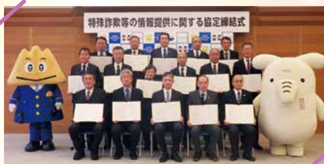
富山県警と協定を結んだJAの組合長

特殊詐欺等の情報提供に関する協定締結式が1月22日、富山県警察本部（富山市）で開かれ、県内14のJAの組合長など関係者が出席しました。