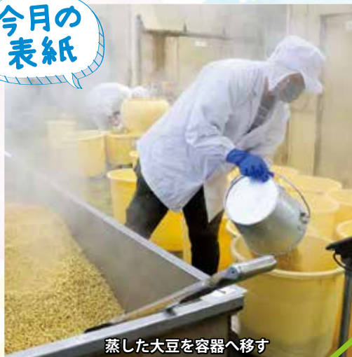
蒸した大豆を容器へ移す