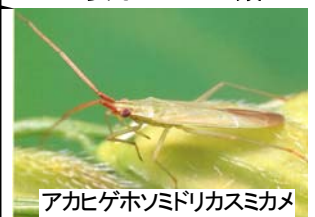
アカヒゲホソドリカスミカメ