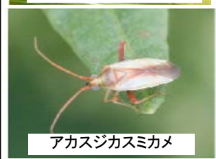
アカスジカスミカメ