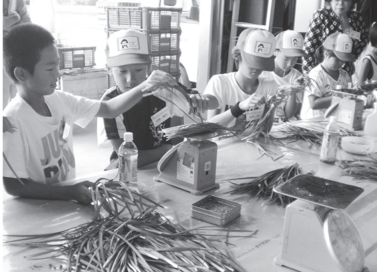
ニラの選別作業を行う児童

めました。二日目は、若草ふれあいセンターで受入農家の方と一緒にニラ入り餃子やごはんのケーキ、デザートを作りました。