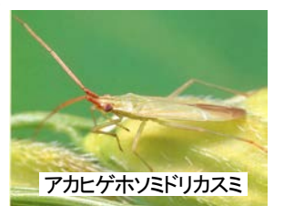
主要な斑点米カメムシ

雑草地等のすくい取り調査結果 (6月23日調査) 平均虫数:12頭(平年:9頭)